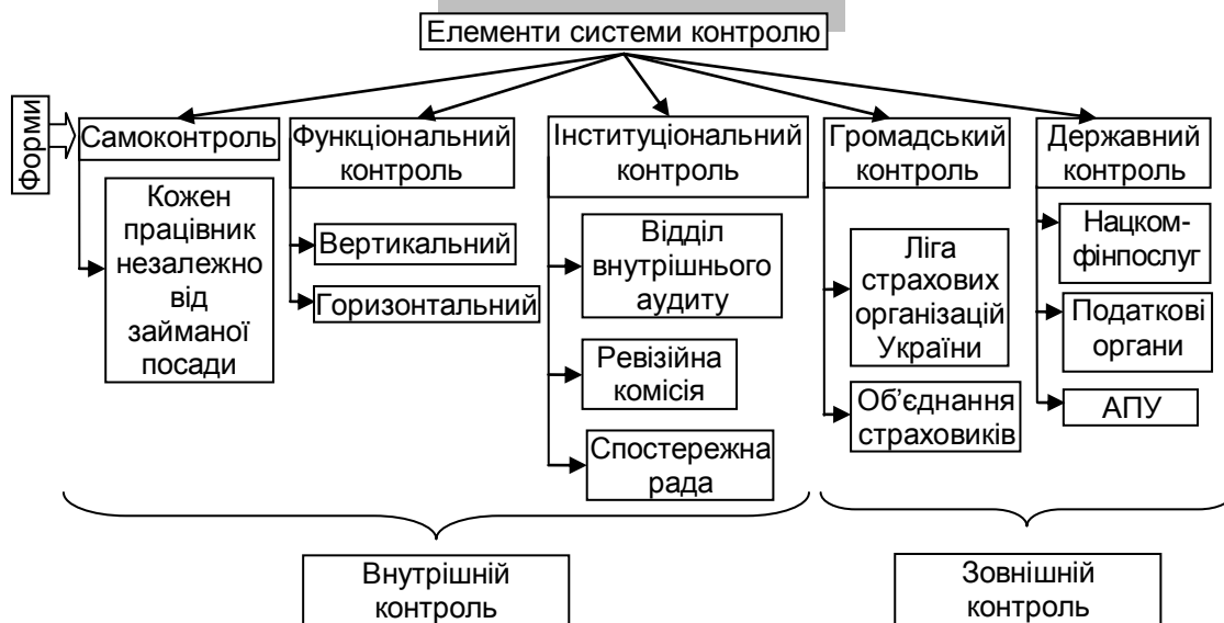
Рис. 2. Організаційна структура системи контролю страхової компанії

Виходячи з вищевикладеного пропонуємо в основу побудови організаційної структури внутрішнього контролю страхової компанії покласти наукові досягнення д.е.н. Т.А. Бутинець, яка запропонувала організаційну структуру системи контролю, що включає чотири форми контролю: самоконтроль, функціональний контроль, інституціональний контроль, громадський контроль, на нашу думку варто ще розглянути державний контроль страховика. Таким чином, на рис. 2 окреслено суб'єкти зовнішнього і внутрішнього контролю за діяльністю страхової компанії.